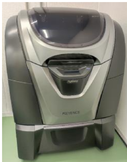
2021年12月導入 3Dプリンター

安定した良品作りは評価出来て初めて効果を確認出来ます。 当社技術を裏付けする測定設備も充実しています。