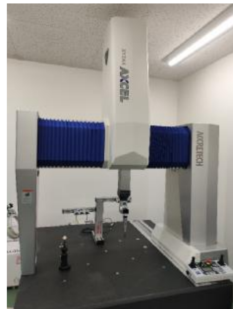
2021年12月導入 三次元座標測定機