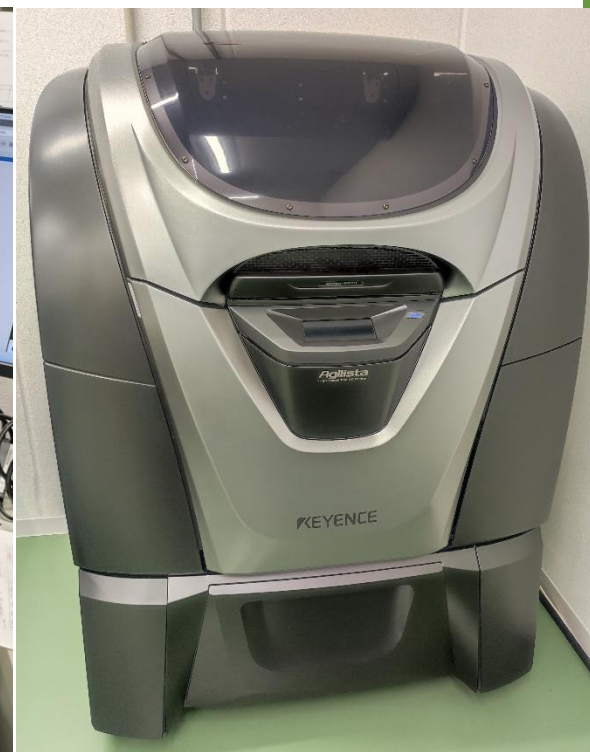
2021年12月導入 3Dプリンター