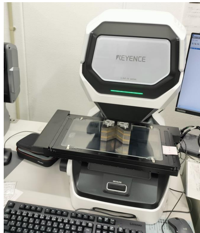
2025年1月導入 三次元画像寸法測定器

安定した良品作りは評価出来て初めて効果を確認出来ます。 当社技術を裏付けする測定設備も充実しています。